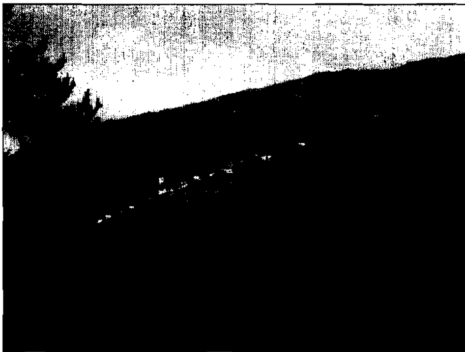
Das schmucke Dörfchen Bannberg mit der Kirche zum hl. Martin liegt auf einem sonnseitigen Bergrücken, der sich zum schmalen Ufer der Drau hinabsenkt.

Anras besaß um diese Zeit nur die niedere Gerichtsherkheit, die hrole oder Blutgerichtsherkheit besaß das Landgericht Lienz, das Kaiser Maximilian den Freiherrn von Wolkenstein verpfändete.