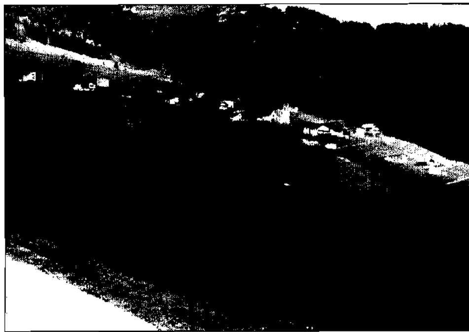
Bannberg — von Kolbenhaus aus gesehen — mit den alten Gerichtsgrenzen: Glibesbachgraben (heute Markbach) und Glibesbachgraben (heute Filgisbach).