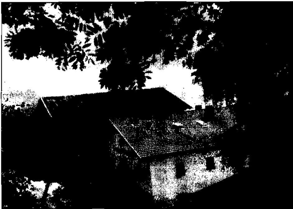
Der Gurter-Hof, urkundlich zuerst in den Musterungslisten erwähnt. Die »Curter« scheinen öfters als Verweser und in ansehnlichen Stellungen als Auswanderer auf.

für 31. VII. 1613 nach Lienz fordern, wo ihnen befohlen werden sollte, Fürstbischof Karl von Brixen nicht zu huldigen. 2)