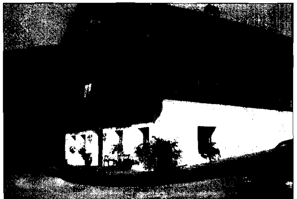
. . . Gschlierer Hof

1494 entflammt der Streit zwischen dem Brixner Bischof und Graf Leonhard nicht nur wegen der Rückgabe von Bannberg, sondern auch um die Ansprüche der Vogtei Sonnen-