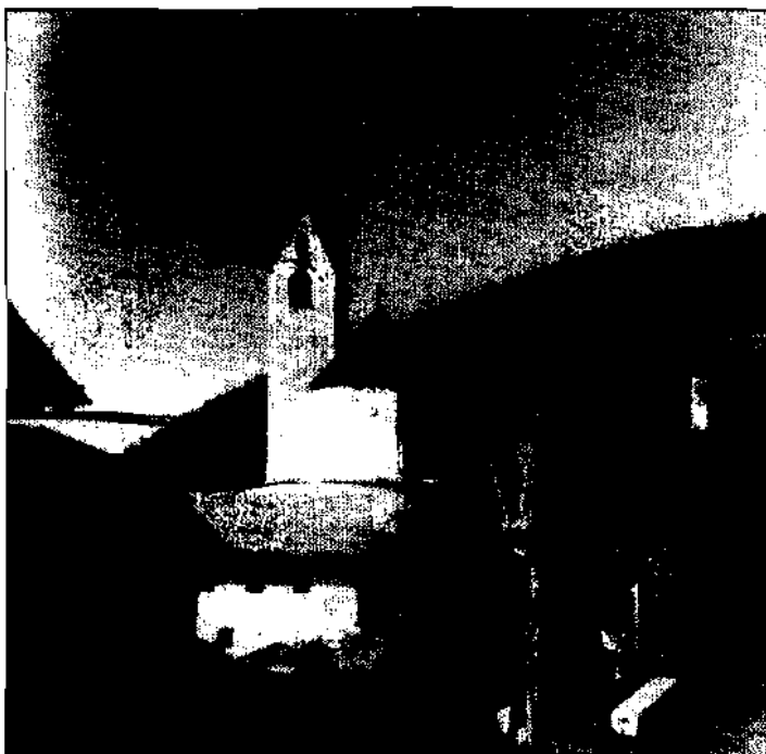
Der Ortskern von Bannberg mit der Kirche zum hl. Martin — früher auch noch Margaretha — 1155 bereits urkundlich erwähnt. Die Bauzeit ist unbekannt.

Das Gericht war gänzlich von görzischem Gebiet eingeschlossen (Gericht Lienzener Klause, Landgericht Lienz).