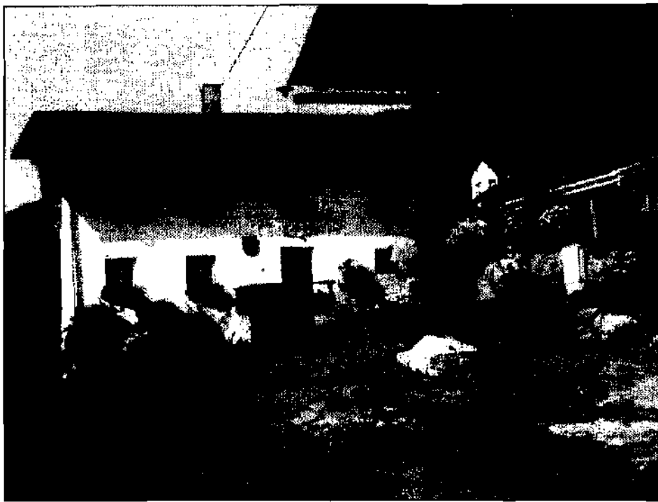
Die ersten urkundlich erwähnten Hofnamen von Bannberg (Anfang des 13. Jahrhunderts). Huber-Hof. . .

Kein Wunder, daß die Grafen von Görz nach immer mehr Rechten in Bannberg trachteten, sodaß die Bewohner förmlich zwischen zwei Mülsteinen leben mußten und im ständigen Streit zwischen Brixen und den Görzern die Leidtragenden waren.